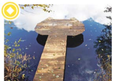
LAIPA – KAĶIS Autors: Raitis Zaldāts-Rozentāls