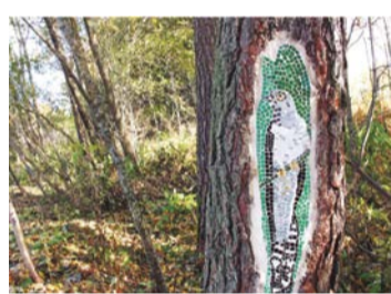
MOZAĪKAS Autore: Jeļena Kažoka