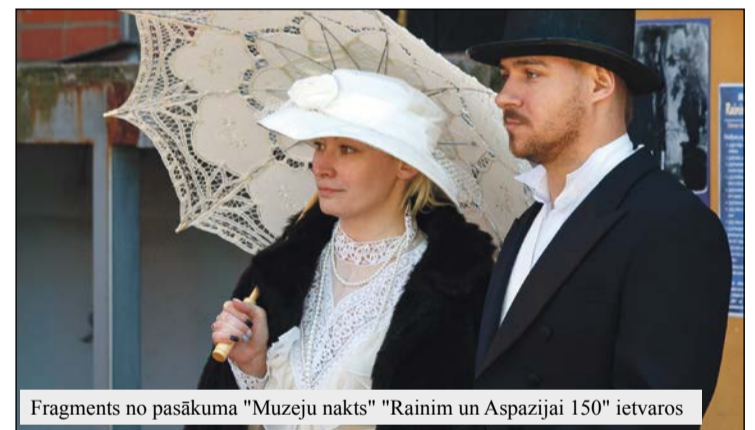
Fragments no pasākuma "Muzeju nakts" "Rainim un Aspazijai 150" ietvaros