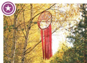
ČETRU STIHIJU UN CILVĒKA MANDALAS Autore: Laura Krampe

Interesenti tika aicināti iesniegt savas idejas un piedalīties skiciu konkursā, aktualizējot kādu no ciemā svarīgajām vides tēmām. Tās savukārt 2015. gada 6. septembrī izvēlējās 24 Jāņupes iedzīvotāji no dažādiem kooperatīviem pastaigu takas ideju darbnīcā, ko vadīja biedrība "homo ecos:".