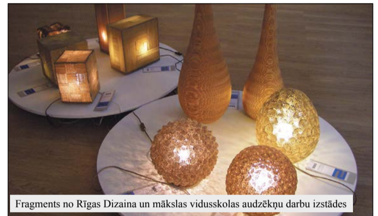
Fragments no Rīgas Dizaina un mākslas vidusskolas audzēkņu darbu izstādes

Muzeja apmeklējums un pakalpojumi ir bez maksas. Muzeja adrese: Zemgales iela 33, 1.stāvs, Olaine.