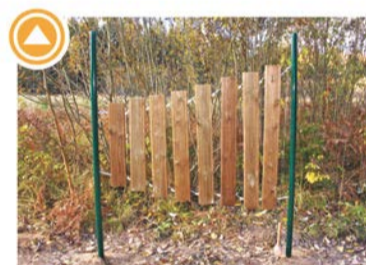
BRĪVDABAS KSILOFONS Autors: Raitis Zaldāts-Rozentāls