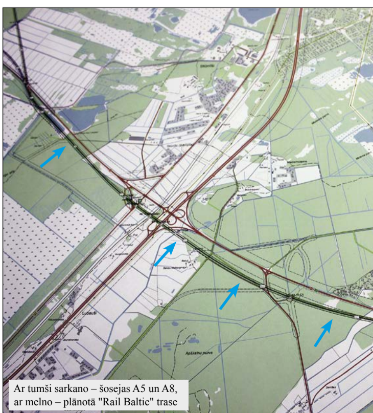
Ar tumši sarkano – šosejas A5 un A8, ar melno – plānotā "Rail Baltic" trase

Rakstiskus komentārus par IVN ziņojumu var iesniegt Vides