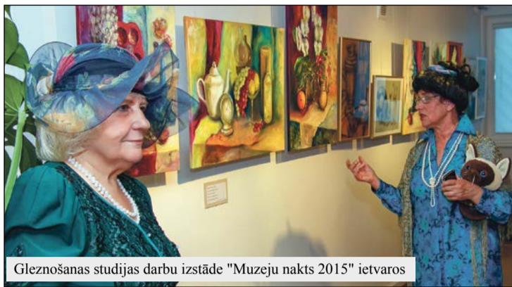
Gleznošanas studijas darbu izstāde "Muzeju nakts 2015" ietvaros

Ar Olaines muzeja palīdzību ir izdotas vairākas grāmatas, saistītas ar Olaines novadu, tā vēs-