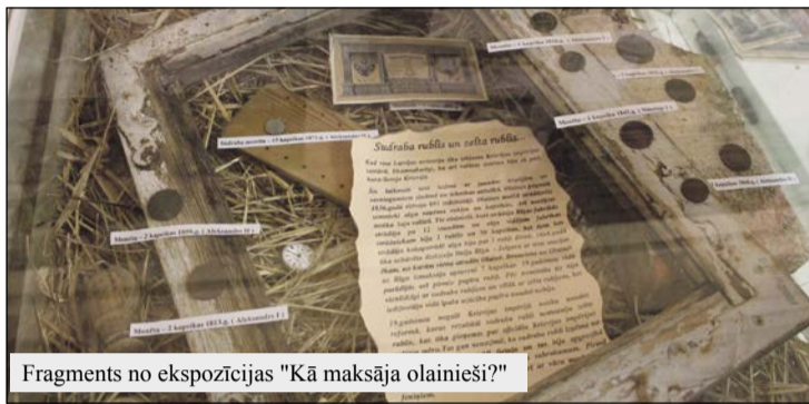
Fragments no ekspozīcijas "Kā maksāja olainieši?"