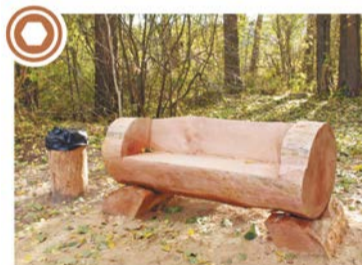
BAĻĶU MISKASTES Autori: Jeļena Kažoka un Gints Kažoks